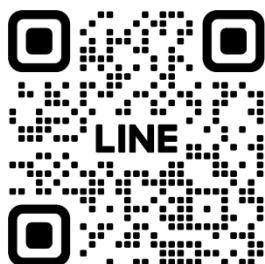
LINE QR コード

公式 LINE のアカウントができました！！最新情報や参加登録が簡単にできるようになります。ぜひご登録ください！